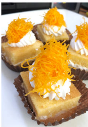
เค้กฝอยทอง