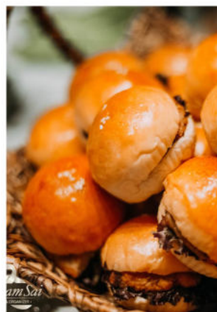
มินิบอร์เกอร์หมู