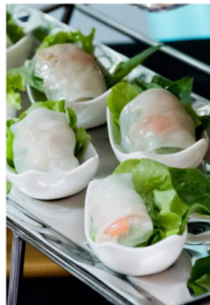
ถ้วยเตี้ยวลุยสวน ไส้หมูนุ่ม