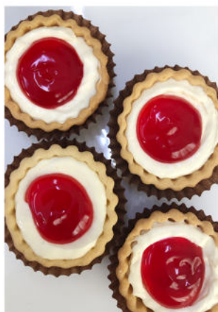
ทาร์ตแยมสตรอเบอร์รี่