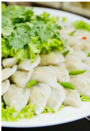
ปั้นสิบนิ้วไส้ปลา

ขนมสอดไส้ STEAMED FLOUR WITH COCONUT FILLINGS