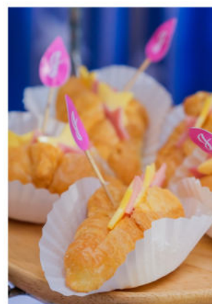
ครัวซองต์แฮม