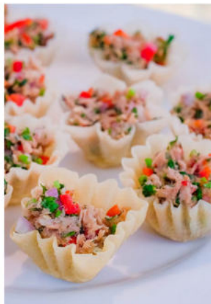
กระหนทอ ไส้ทูน่ายำ