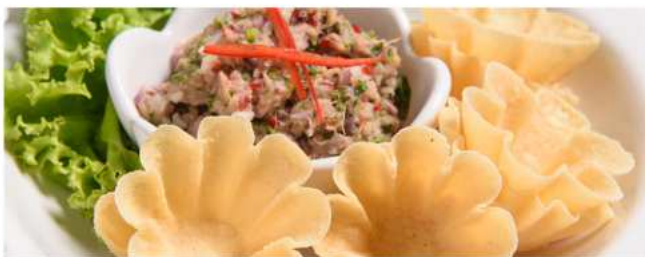
กระทงทอ ไข่กุกน่ายำ