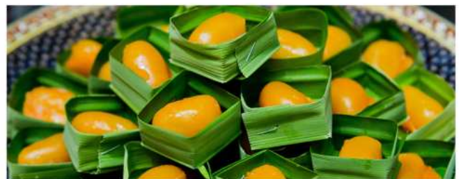
เม็ดขนุน

** รายการขนมแต่ละเซต สามารถสลับปรับเปลี่ยนกันได้ / SNACK ITEMS FROM EACH SET MENU CAN BE SWAPPED