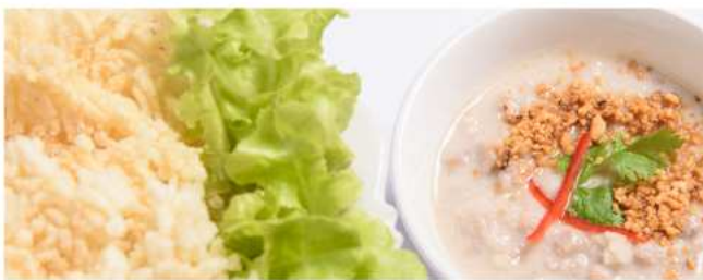
ข้าวตังหน้าตั้ง